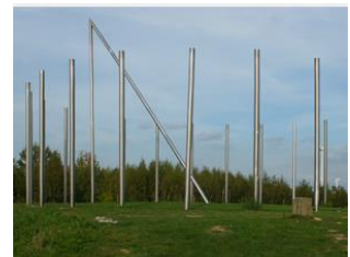
Afbeeldingen Haldekunst :

http://www.ruhrgebiet-industriekultur.de/halden.htm