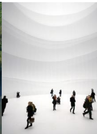
Christo's werk in de Gasometer