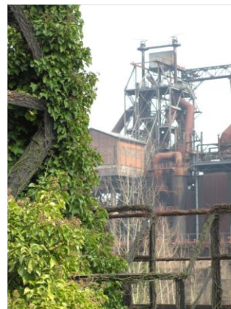
Landschaftspark Duisburg Nord